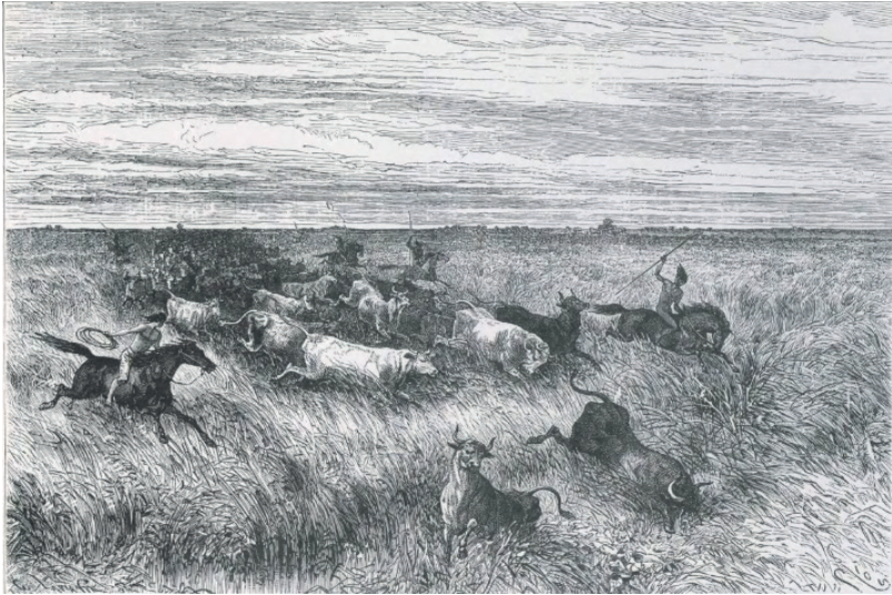
ILUSTRACIÓN N° 1. «Un rodeo en los llanos». Extraído de Charles Saffray y Edouard André (1968), 120.

a la imaginación, con caballos adornados con pinturas de guerra hechas a base de onoto, y con sus crines trenzadas de forma ceremonial. [Ver ilustración N° 1]