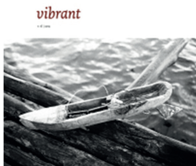
Portada de Vibrant volumen 17.