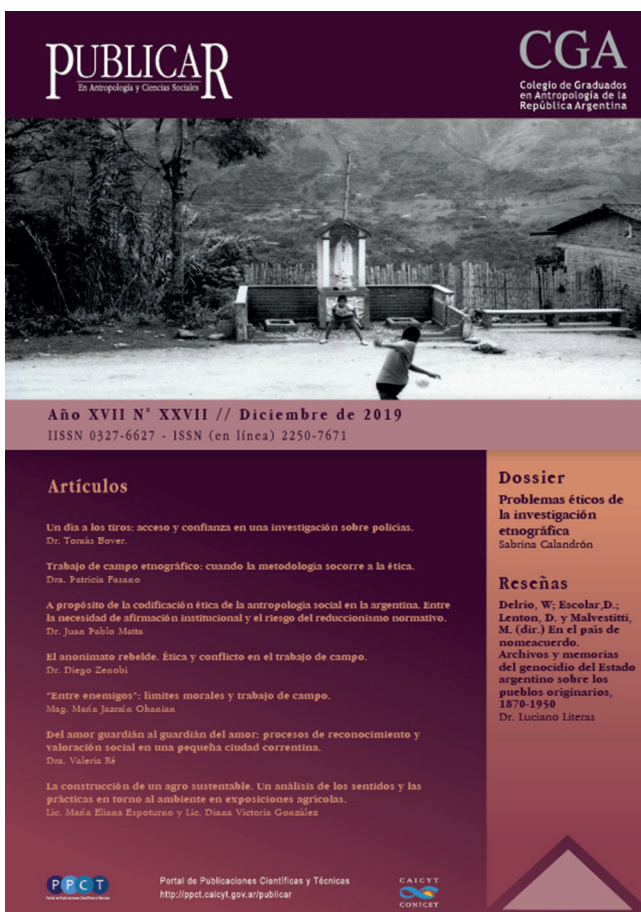
Portada de PUBLICAR número 27.

Puedes ver el número 27 completo en el siguiente enlace web, por donde también puedes enviar tus contribuciones: http://ppct.caicyt.gov.ar/index.php/publicar/index .