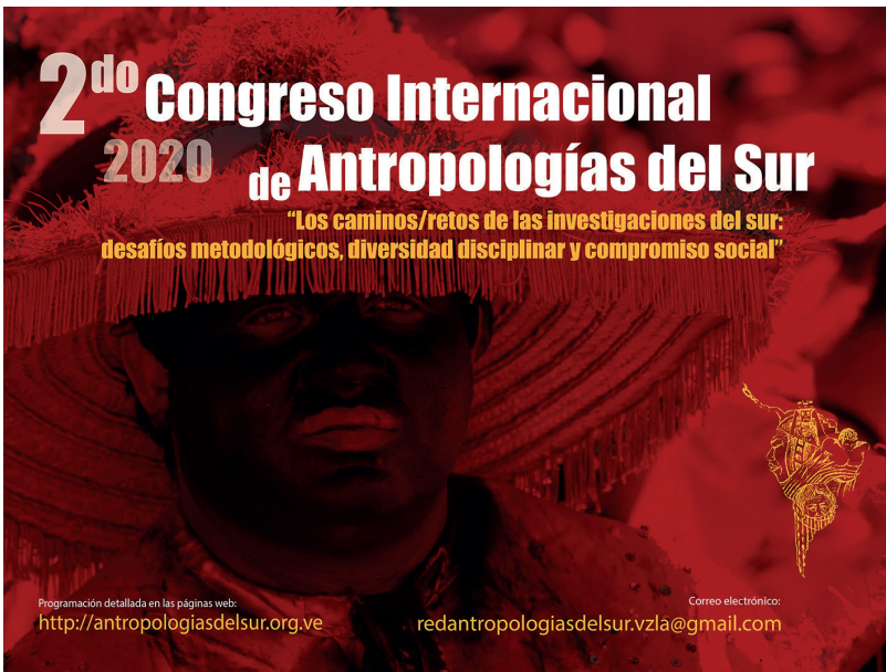
Afiche del 2do Congreso Internacional de Antropologías del Sur 2020.

La Red de Antropologías del Sur pospuso parte del 2do Congreso Internacional de Antropologías del Sur 2020, que se realizaría desconcentrado en doce capítulos en cuatro países: Argentina, Brasil, Colombia y Venezuela, desde marzo hasta julio de este año. Solo se pudieron realizar las sesiones del Capítulo Falcón-Venezuela. El Comité Organizador está reprogramando algunos capítulos para realizarlos en modalidad virtual el último trimestre del 2020 y el resto de capítulos se hará presencial en el 2021. Para conocer las novedades, te invitamos a revisar la página web: http://antropologiasdelsur.org.ve/ .