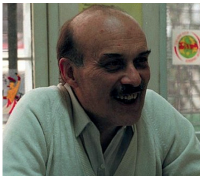
Renzo Pi Ugarte (Durazno 1934 – Montevideo 2012).

Antropóloga social, pionera de la antropología de la familia y la antropología médica, publicó Familia, cultura en Colombia (1963), Medicina tradicional en Colombia: magia, religión y curanderismo (1985) y Honor, familia y sociedad en la estructura patriarcal (1988). Obtuvo la principal distinción de su país, la Cruz de Boyacá, y en 2016 se estampó su imagen en billetes de circulación nacional.