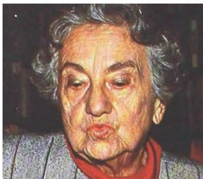
Virginia Gutiérrez de Pineda (Colombia 1921-1999).