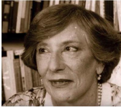
Isabel Aretz (Buenos Aires 1909 - San Isidro 2005).

Así que, por las dudas, hagamos algunas aclaraciones sobre las fotos del comienzo, y vayamos al cierre de este artículo: