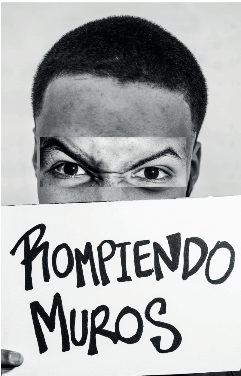
Autores varios. Colombia. Participantes de Relatos Internos . 2018. Collage 4 .