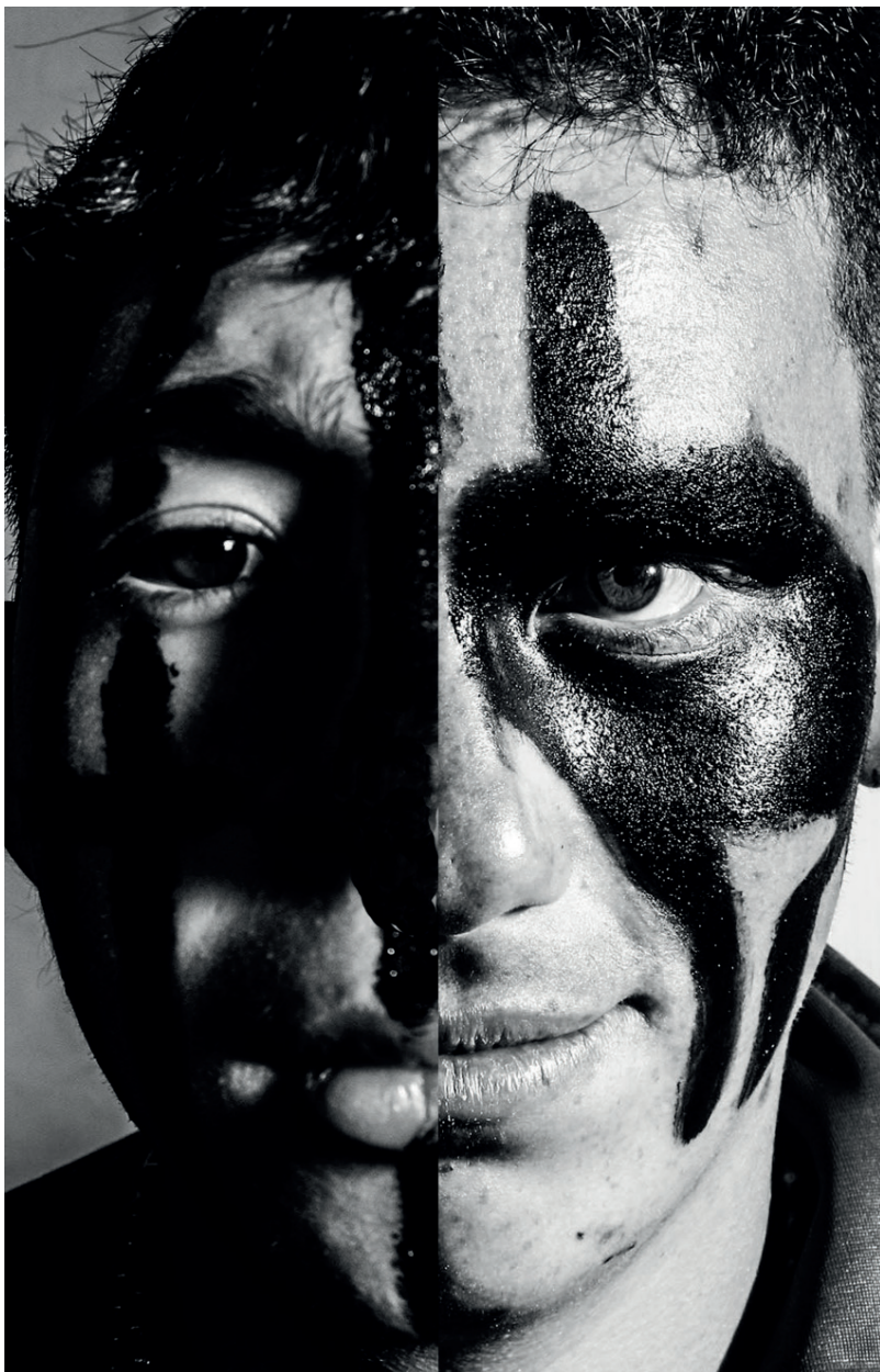
Autores varios. Colombia. Participantes de Relatos Internos . 2018. Collage 1 .