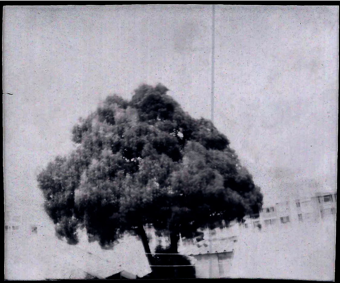
Jhoiner Bellaco. Colombia. Participante de Relatos Internos . 2019. «El árbol de las caras».