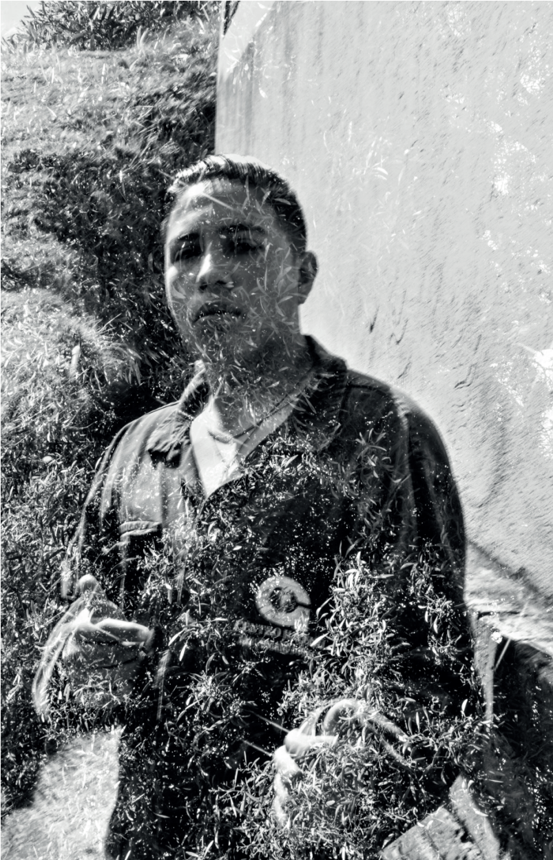
Autor anónimo. Colombia. Participantes de Relatos Internos . 2018. Sin título.