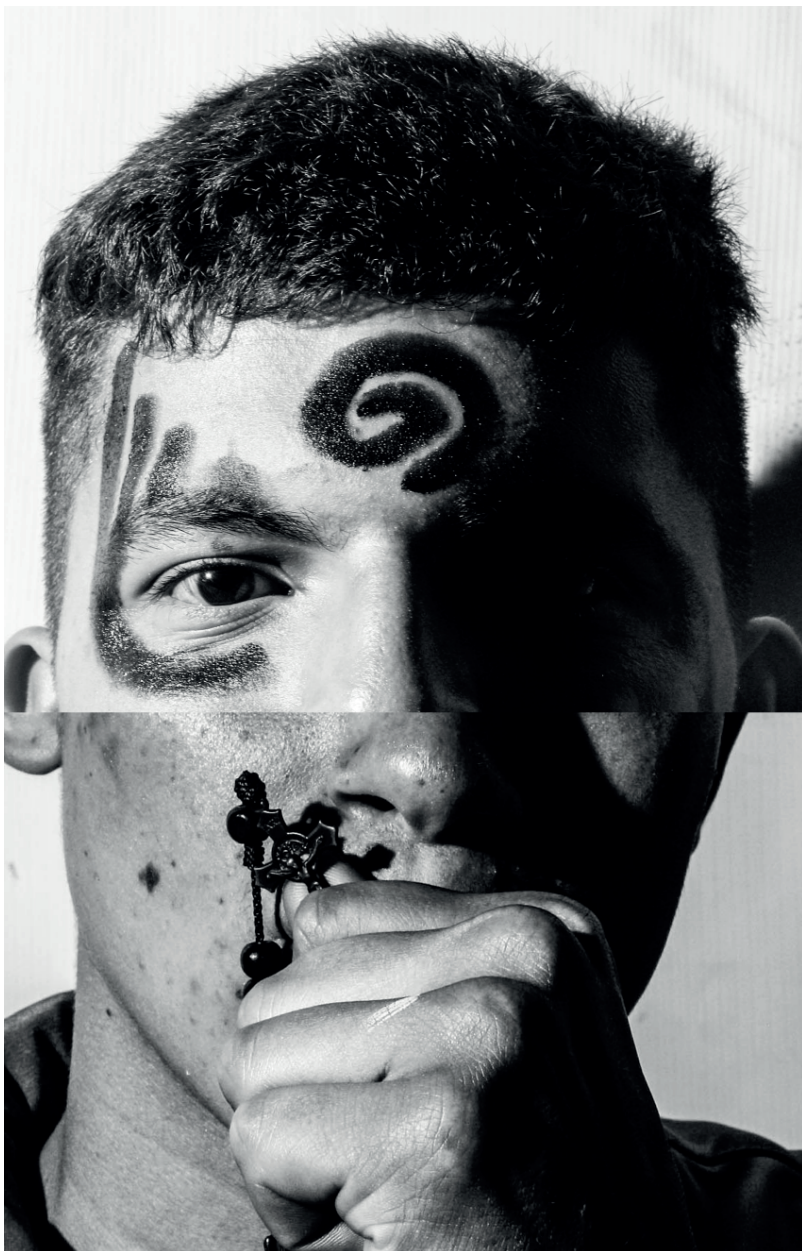
Autores varios. Colombia. Participantes de Relatos Internos . 2018. Collage 2 .